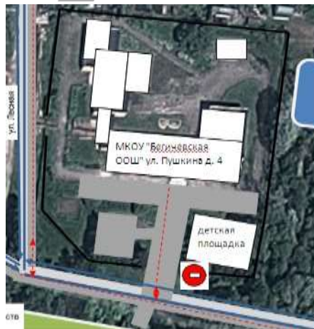
Фото на странице: 2